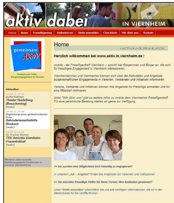
(Startseite der Homepage www.aktiv.in.viernheim.de )

Eine Gelegenheit dazu bietet auch unsere Ehrenamts-Jobbörse im Internet. 35 verschiedene Viernheimer Vereine (vier mehr als 2010) bzw. gemeinnützige Institutionen suchen derzeit über www.aktiv.in.viernheim.de Menschen, die sich gerne ehrenamtlich bei ihnen engagieren möchten. Wir laden weitere Vereine oder ehrenamtliche Initiativen ein, die Ehrenamtsbörse zu nutzen.