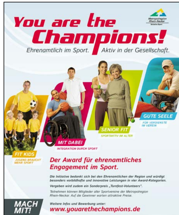
(Plakat der Aktion: „You are the Champions!“)

Die Realisierung der Projekte muss entweder durch einen Ehrenamtlichen oder – sofern mehrere daran beteiligt waren – mehrheitlich durch Ehrenamtliche erfolgt sein.