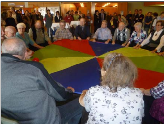
(Foto: Vorführung der Parkinsongymnastikgruppe)

Die Hemmschwelle, sich konstruktiv mit Krankheiten und Betroffenen auseinander zu setzen, ist bei vielen Menschen deutlich gesunken und die Bereitschaft, sich in einer Gruppe regelmäßig zu treffen und sich gegenseitig zu unterstützen und zu helfen ist gestiegen.