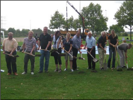
(Foto: Die Gerätepaten mit Bgm. und 1. Stadtrat beim Spatenstich am 04.09.2011)

Dank der großzügigen Unterstützung von verschiedenen Firmen und Betrieben aus der Privatwirtschaft steht nun ein Open-Air Fitnessparcours mit insgesamt 14 Fitnessübungsgeräten zur Verfügung, der von allen Bürgerinnen und Bürgern, unabhängig vom Alter, von der Körpergröße oder vom sportlichen Leistungsstand genutzt werden kann.