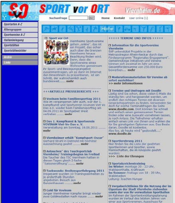
(Startseite der Homepage www.svo.viernheim.de )

Ganz im Sinne der „Bürgerkommune“ konzipierten die Sportvereine Viernheims gemeinsam mit der Stadtverwaltung im Jahr 2004 die Internetseite www.svo.viernheim.de .