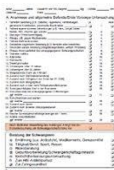
Mutterpass Innenblatt mit Untersuchungsdaten

La donna incinta dovrebbe portare sempre con sè tale libretto, in modo che in caso di emergenza sia possibile prendersi cura al meglio di lei e del nascituro. Il libretto sanitario di gravidanza deve essere presentato ad ogni visita dal medico, in ospedale oppure dal dentista. Ci sono infatti molte medicine che non possono essere somministrate a donne gravide ed alcuni esami non possono essere fatti.