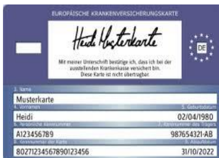
Muster einer Gesundheitskarte (Rückseite)

Il medico richiederà il proprio compenso direttamente dall'assicurazione sanitaria.