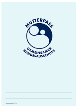
Mutterpass Deckblatt материнская книжка, обложка

Die Schwangere sollte den Mutterpass immer mit sich führen, damit ihr und dem werdenden Kind in einer Notsituation besser geholfen werden kann. Der Mutterpass muss bei jedem Arzt-, Krankenhaus- oder Zahnarztbesuch vorgezeigt werden. Bei Schwangeren dürfen nämlich viele Medikamente nicht verabreicht und manche Untersuchungen nicht durchgeführt werden.