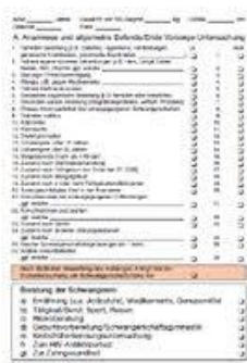
Mutterpass Innenblatt mit Untersuchungsdaten материнская книжка, страница с результатами обследований

Беременным следует всегда иметь эту материнскую книжку при себе, чтобы в экстренной ситуации им и ребенку можно было лучше оказать помощь. Материнская книжка должна предъявляться при каждом посещении врача, зубного врача или больницы, так как во время беременности многие медикаменты и некоторые обследования не применяются.