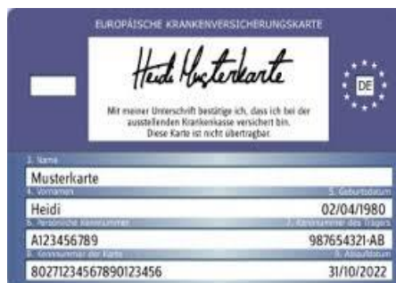
Мuster einer Gesundheitskarte (Rückseite)

Врач производит расчет непосредственно со страховой компанией.