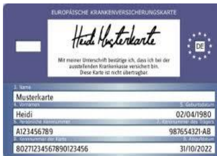
Muster einer Gesundheitskarte (Rückseite) Sađlık kartı örneğı (Arka yüz)

Doktor hizmetlerini doğrudan ilgili sađlık sigortası kurumuna fatura eder.