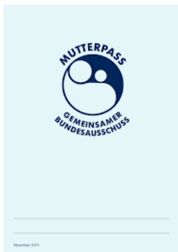
Mutterpass Deckblatt Anne karnesi: kapak sayfası

Die Schwangere sollte den Mutterpass immer mit sich führen, damit ihr und dem werdenden Kind in einer Notsituation besser geholfen werden kann. Der Mutterpass muss bei jedem Arzt-, Krankenhaus- oder Zahnarztbesuch vorgezeigt werden. Bei Schwangeren dürfen nämlich viele Medikamente nicht verabreicht und manche Untersuchungen nicht durchgeführt werden.