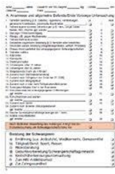
Mutterpass Innenblatt mit Untersuchungsdaten Anne karnesi: Muayene verilerini iereren i sayfa

Hamile kadının bu karneyi, muhtemel acil bir durumda kendisine ve dođmamıř bebeđine en iyi řekilde müdahale edilebilmesi için her zaman beraberinde götürmesi tavsiye olunur. Anne karnesinin her doktor, hastane veya diř doktoru ziyaretinde ibraz edilmesi gerekmektedir. Çünkü hamile kadınlara birtakım ilaçların verilmemesi ve bazı muayenelerin yapılmaması gerekmektedir.