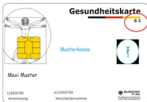
Muster einer Gesundheitskarte (Vorderseite) Sağlık kartı örneği (Ön yüz)

Der Arzt rechnet dann direkt mit der Krankenversicherung ab.