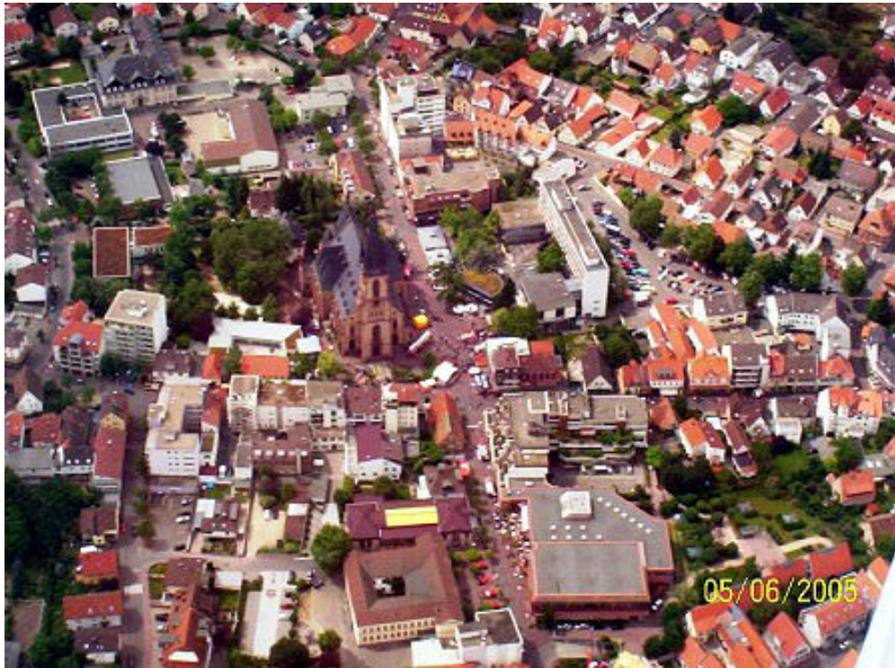
Luftbildaufnahme Innenstadtbereich Viernheim