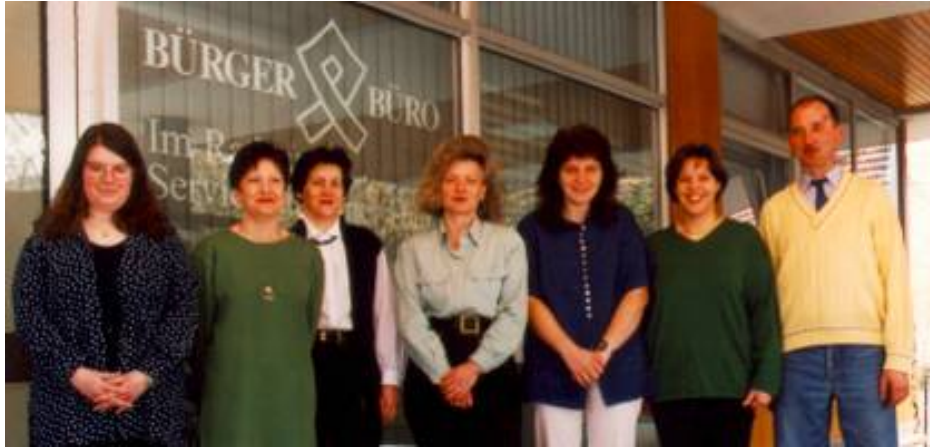
Archivbild Mitarbeiter 1998