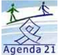
Logo Agenda 21