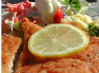
Schnitzel mit Zitronenscheibe