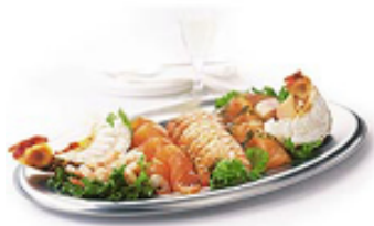
Platte mit Fisch und Meerersfrüchten