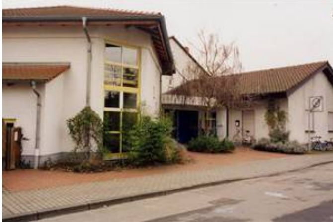
Außenansicht Kiga St. Michael