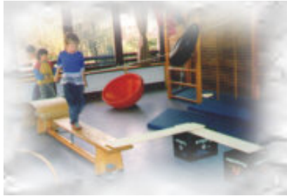
Kinder im Gymnastikraum