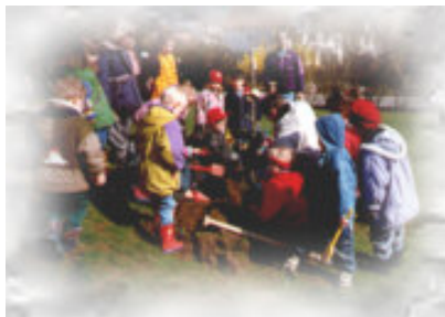
Kinder im Freigelände