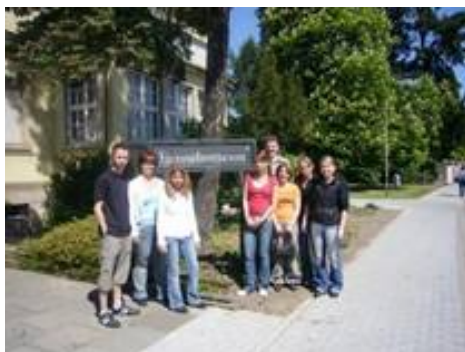
Auszubildende der Stadt Viernheim vor dem Eingang des Heimatmuseums.