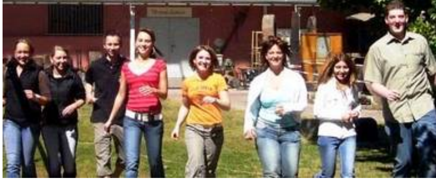
Auszubildende der Stadt Viernheim im Museumgarten