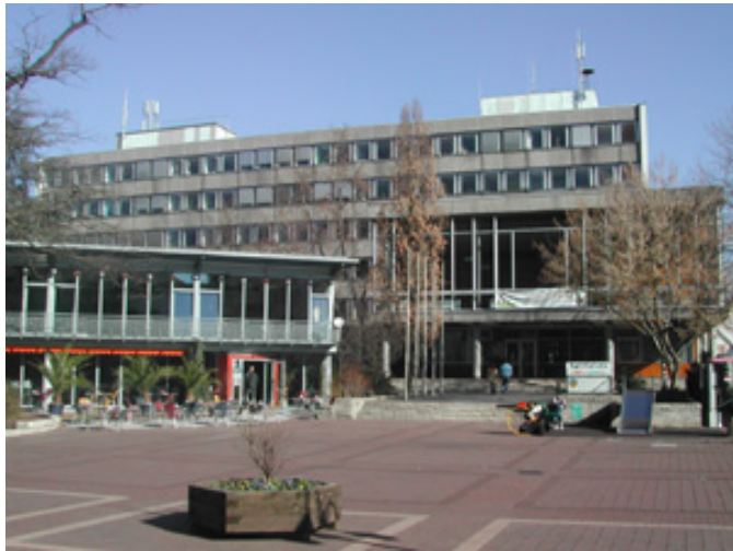
Rathaus Stadt Viernheim