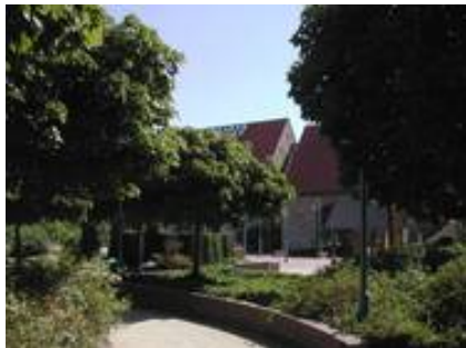
Weg zum Scheunenensemble