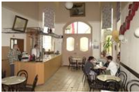
Cafe im TiB