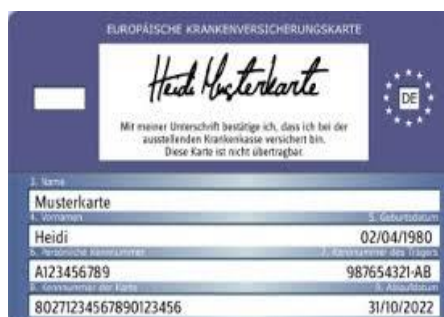
Muster einer Gesundheitskarte (Rückseite)

След това лекарят урежда всичко директно със здравната каса.