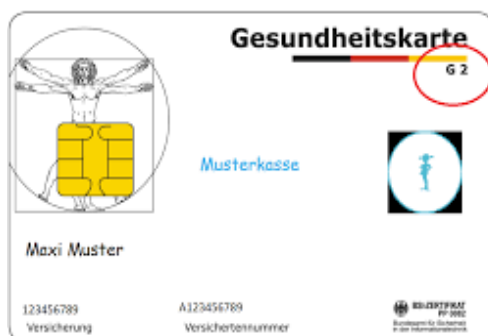
Muster einer Gesundheitskarte (Vorderseite)

Der Arzt rechnet dann direkt mit der Krankenversicherung ab.