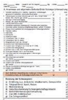
Mutterpass (Innenblatt mit Untersuchungsdaten)

Бременните жени трябва да носят тази книжка по всяко време със себе си, за да могат те и бъдещото им дете да получат помощ бързо в случай на спешност. Тя трябва да бъде представяна при всяко посещение на лекар, зъболекар или престой в болница, тъй като много лекарства не трябва да се прилагат на бременни жени, нито трябва да бъдат подлагани на определени прегледи.