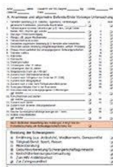
Mutterpass Innenblatt mit Untersuchungsdaten

La donna incinta dovrebbe portare sempre con sè tale libretto, in modo che in caso di emergenza sia possibile prendersi cura al meglio di lei e del nascituro. Il libretto sanitario di gravidanza deve essere presentato ad ogni visita dal medico, in ospedale oppure dal dentista. Ci sono infatti molte medicine che non possono essere somministrate a donne gravide ed alcuni esami non possono essere fatti.