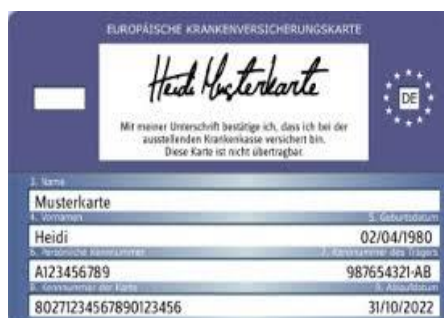
Muster einer Gesundheitskarte (Rückseite)

Il medico richiederà il proprio compenso direttamente dall'assicurazione sanitaria.