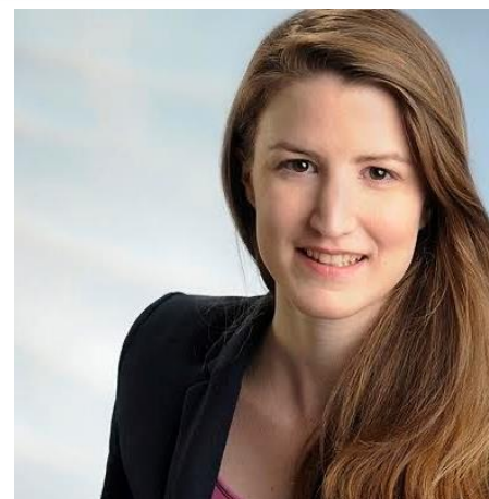
Inga Freund Fördermittelberatung