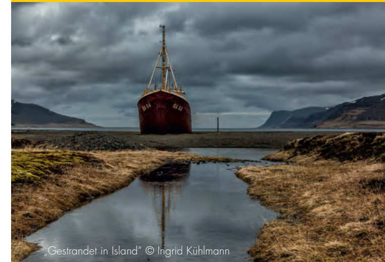
„Gestrandet in Island“

Fotoausstellung des Fotoclub Viernheim e.V.